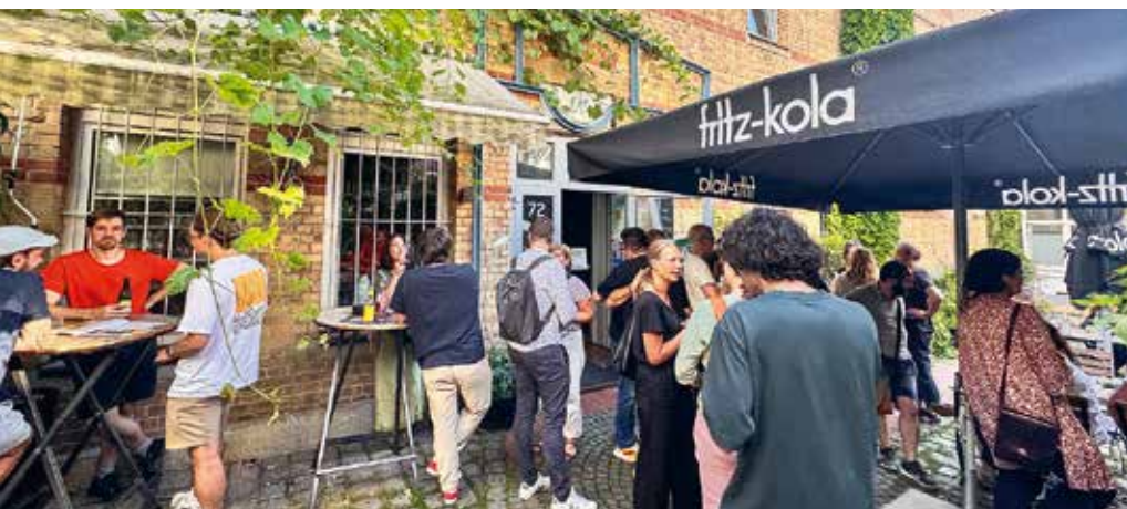
Monatlicher Jour Fixe im sommerlichen Hinterhof des Stuttgarter Kulturzentrums Merlin