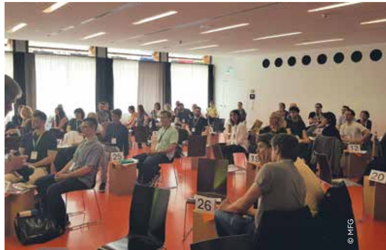
DOKVILLE 2024: Speeddating

Als Speaker und Impulsgeber haben unter anderem CAMPINO, Frontmann der Toten Hosen, der Publizist MICHEL FRIEDMAN, der thüringische Verfassungsschutzpräsident STEPHAN KRAMER, der ehemaliger Verfassungsrichter und Ministerpräsident des Saarlandes PETER MÜLLER, der Intendant des SWR KAI GNIFFKE, der stellvertretende Minister-