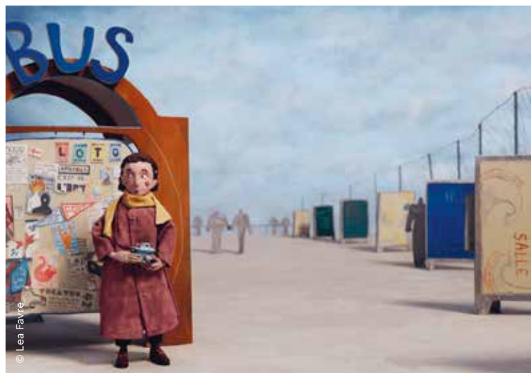
Szene aus dem Kurzfilm »Hunting«, für den die Schweizer Regisseurin LEA FAVRE mit dem diesjährigen Lotte Reiniger Förderpreis ausgezeichnet wurde

LEA FAVRE hat an der L'école cantonale d'art de Lausanne (ECAL) studiert und behandelt in ihrem Film einen Fall von verbaler Belästigung durch einen älteren Mann, den sie auf ähnliche Weise selbst erlebt hat. Dazu nutzt sie das klassische Stop-Motion-Verfahren des Puppentrickfilms, dessen verspielte Optik in der zweiten Hälfte des sechsminütigen Films von der dominanten männlichen Stimme aus dem Off konterkariert wird, während das Bild auf der Leinwand nahezu dunkel bleibt. Ein bewusster Stilbruch, der das Ausmaß der Bedrängung deutlich macht. Die dreiköpfige Fachjury begründete ihre Entscheidung mit folgenden Worten: »Die naive Ästhetik verstärkt ihre Wirkung, indem sie unerwartet von lustig und leichtfüßig zu aggressiv wechselt. Ein ehrlicher, wichtiger und zum Nachdenken anregender Film.« Eine Lobende Erwähnung (Special Mention) geht an den Regisseur JUSTIN FAYARD von der Pariser École nationale supérieure des Arts Décoratifs für seinen animierten Kurzfilm »Hic Svnt Dracones«. Die Auszeichnungen wurden den Filmschaffenden im Rahmen einer festlichen Preisgala von ROBERT GEHRING, Unitleiter Filmförderung der MFG Baden-Württemberg, überreicht.