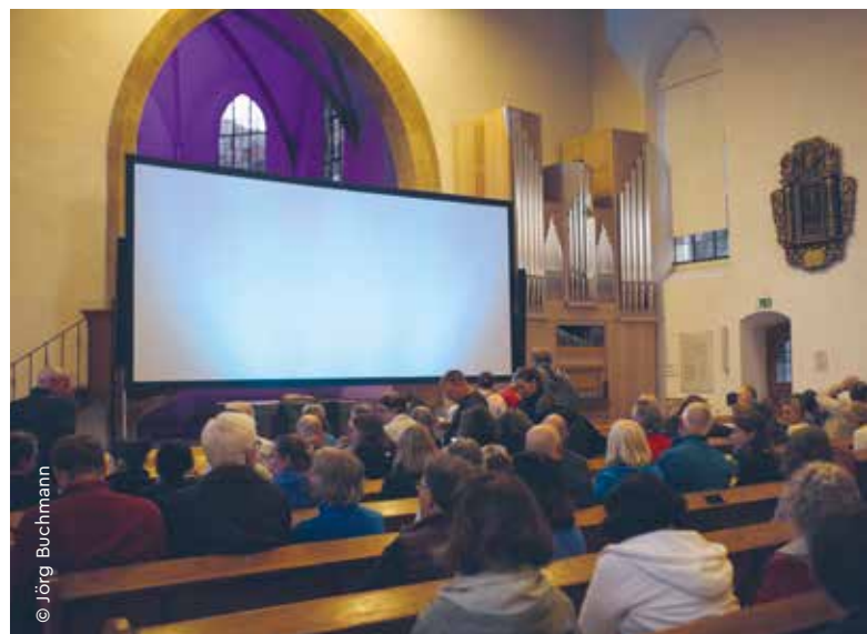
Auch die Kirchen öffnen ihre Pforten für das Kinomobil: Kirche in Ichenheim