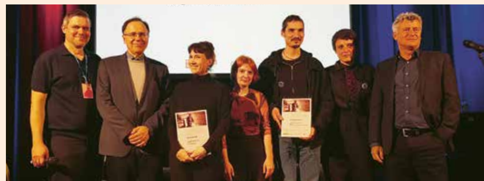
▲▲ Verleihung des Deutschen Dokumentarfilmpreises im Juli 2024 in Stuttgart