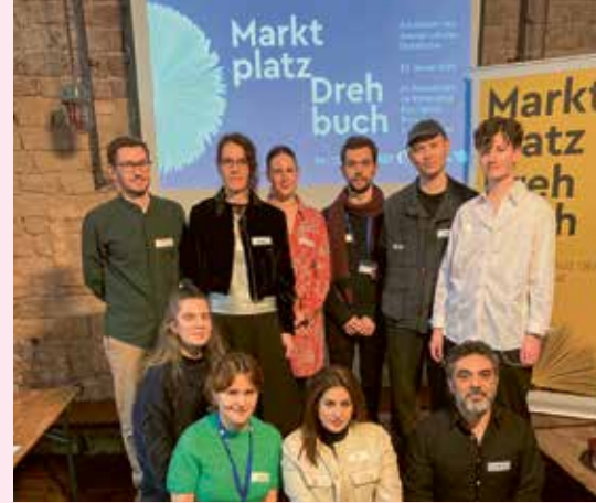
Pitching-Kandidat*innen beim »Marktplatz Drehbuch« 2025 in Saarbrücken