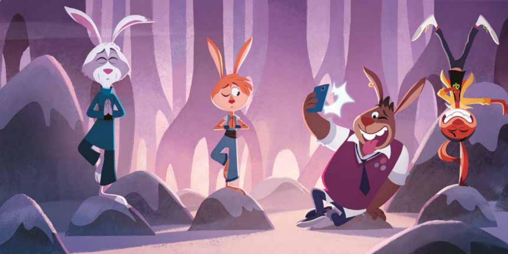
Szene aus »Rabbit Academy – Die Serie zur Häschenschule« © SERU Animation, Akkord Film, 2min, Thienemann, SWR, NDR, KIKA, HR