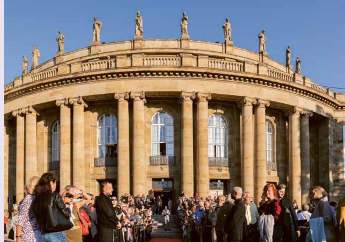
Nominierung für den European Location Award: »Großes Haus« in Stuttgart – hier der Empfang für SAM RILEY zur Premiere von »Cranko« im September 2024