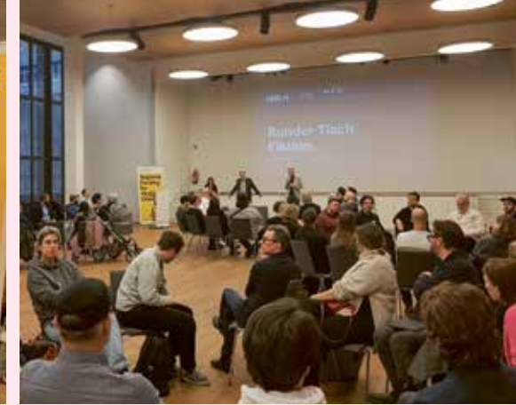
»Runder Tisch« der MFG Filmförderung für Produzent*innen und Filmschaffende in der Region im Dezember 2024