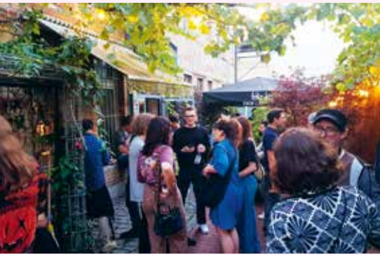
Monatlicher Jour Fixe der Filmbranche im Südwesten